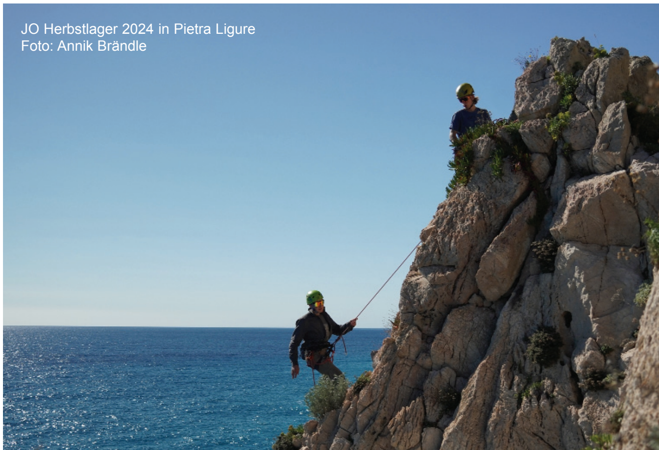
JO Herbstlager 2024 in Pietra Ligure

Auskunft: Bei Fragen stehen dir die JO Leiter des Uster und Uetiker Klettertrainings gerne zur Verfügung.