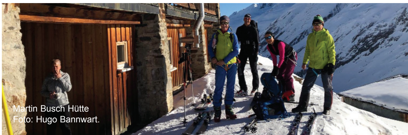
Martin Busch Hütte

Gib deine neue Adresse online unter www.sac-cas.ch ein oder schreibe an: Michi Bollinger, Eichackerstr. 21, 8132 Egg