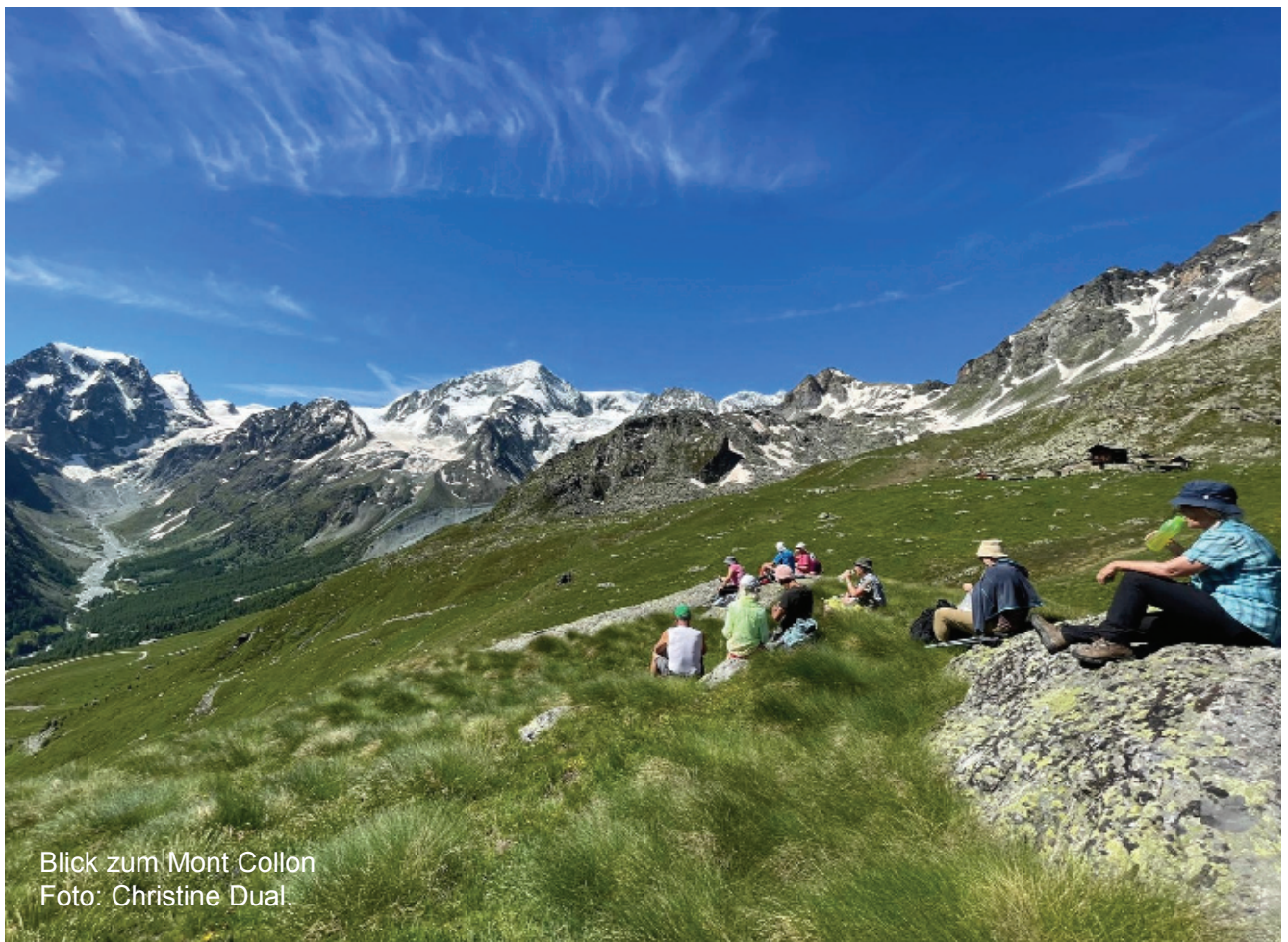
Blick zum Mont Collon

Auskunft: Bei der Tourenleiterin Tel. 079 574 81 19