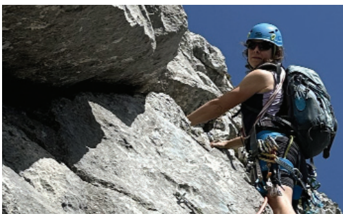
Galtigengrat (Pilatus)