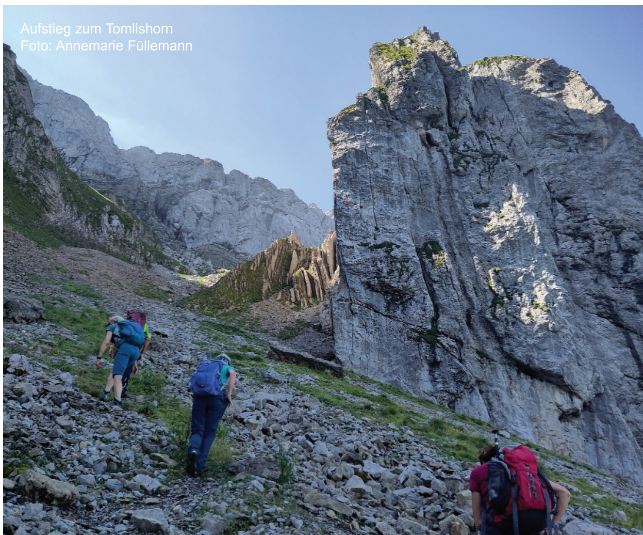
Aufstieg zum Tomlishorn